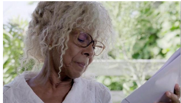
Avec la participation exceptionnelle de Simone Schwarz-Bart