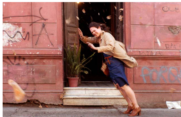
Une femme fantastique

REMERCIEMENTS : CINEMACHILE : CONSTANZA ARENA, ANA TORES ; APTC ; PROCHILE ; AD VITAM, ARIZONA DISTRIBUTION, ASC DISTRIBUTION, MARGO FILMS, OPTIMALE DISTRIBUTION, WILD BUNCH DISTRIBUTION