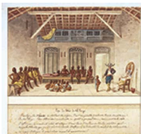
5. J.-B. Debret, Marché de la rue du Valongo Ca 1820/1830 Aquarelle sur papier 17,5 x 26,2 cm Collection Musées Castro Maya Rio de Janeiro