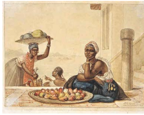
14. J.-B. Debret, Négresse avec tatouages vendant des noix de cajou 1827 Aquarelle sur papier 15,7 x 21,6 cm Collection Musées Castro Maya Rio de Janeiro