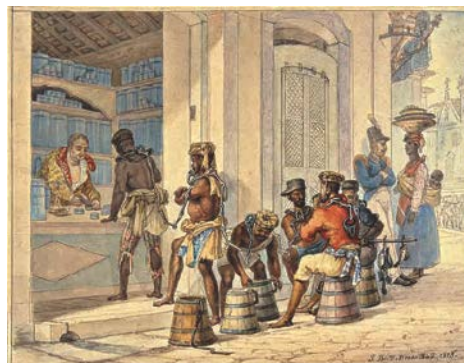
2. J.-B. Debret, Boutique de tabac 1823 Aquarelle sur papier 18,2 x 23,5 cm Collection Musées Castro Maya Rio de Janeiro