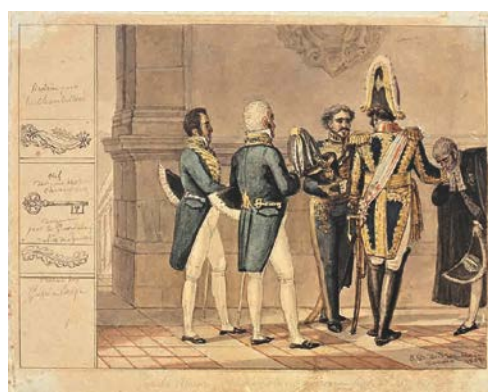
12. J.-B. Debret, Un noble brésilien baisant la main de son altesse l'Empereur Pedro Ier 1827 Aquarelle sur papier 15,8 x 21,7 cm Collection Musées Castro Maya Rio de Janeiro