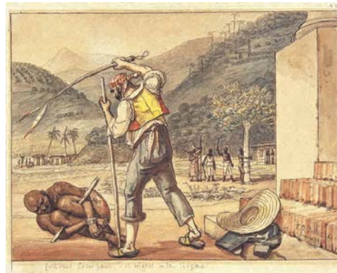
8. J.-B. Debret, Régisseur fouettant des nègres dans une propriété agricole 1828 Aquarelle sur papier 14,9 x 19,8 cm Collection Musées Castro Maya Rio de Janeiro