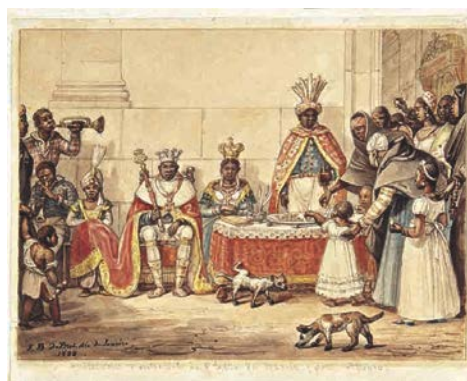
4. J.-B. Debret, Collecte pour l'Eglise du Rosario Porto Alegre 1828 Aquarelle sur papier 14,5 x 19,9 cm Collection Musées Castro Maya Rio de Janeiro