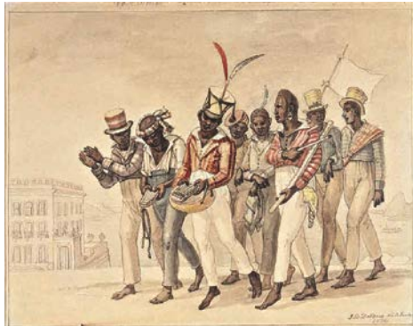
7. J.-B. Debret, Promenade du dimanche après-midi 1826 Aquarelle sur papier 17,4 x 22,5 cm Collection Musées Castro Maya Rio de Janeiro