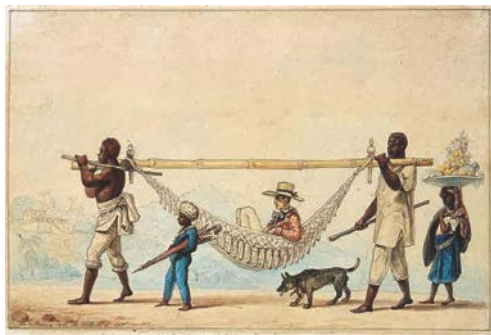
9. J.-B. Debret, Retour à la ville d'un propriétaire de maison de campagne 1822 Aquarelle sur papier 16,3 x 24,5 cm Collection Musées Castro Maya Rio de Janeiro