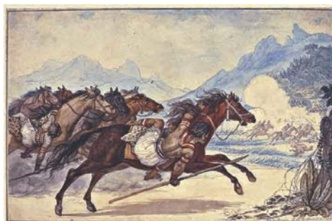
3. J.-B. Debret, Charge de cavalerie Guaicuru 1822 Aquarelle sur papier 17 x 26 cm Collection Musées Castro Maya Rio de Janeiro