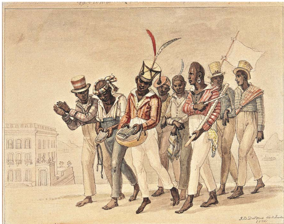
J.-B. Debret Promenade du dimanche après-midi, 1826 Aquarelle sur papier, 17,4 x 22,5 cm Collection Musées Castro Mava, Rio de Janeiro