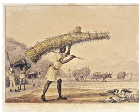
6. J.-B. Debret, Porteur de botte de foin 1826 Aquarelle sur papier 15,5 x 21,6 cm Collection Musées Castro Maya Rio de Janeiro