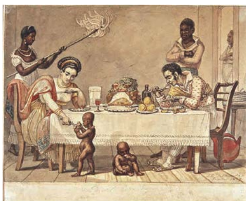
11. J.-B. Debret, Un déjeuner brésilien 1827 Aquarelle sur papier 15,7 x 21,9 cm Collection Musées Castro Maya Rio de Janeiro