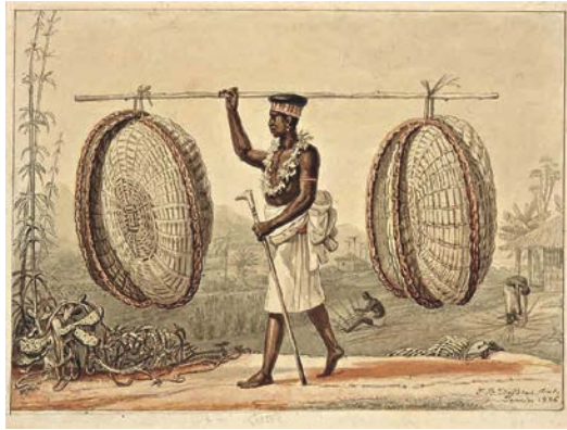
13. J.-B. Debret, Vendeur de paniers 1826 Aquarelle sur papier 15,8 x 21,5 cm Collection Musées Castro Maya Rio de Janeiro